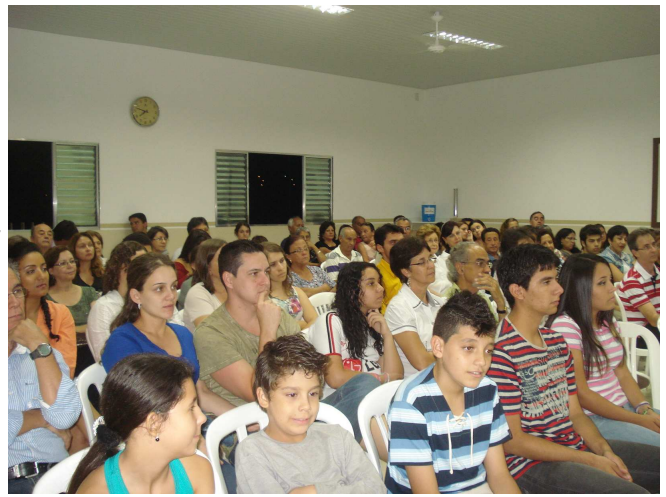
Público presente no Grupo Espírita da Amizade