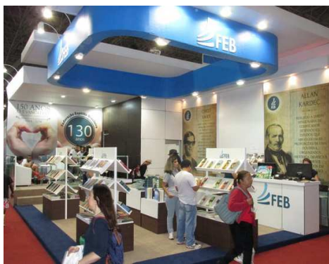
Estande da FEB na Bienal Internacional do Livro

De 22 a 31 de agosto, no Anhembi, grande público visitou o estande da FEB na Bienal Internacional do Livro em São Paulo. O destaque da FEB, este ano, girou em torno do tema "150 anos de O Evangelho Segundo o Espiritismo ". Com lançamentos de livros e um vultoso acervo o estande da FEB chamou atenção das pessoas que movimentavam intensamente a Bienal. Várias editoras espíritas, também, estiveram presentes.