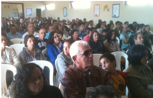
Público presente na Pratinha no 11º Encontro Espírita da Amizade “Chico Xavier”

Folha: Muito obrigado! Deus lhe abençoe.