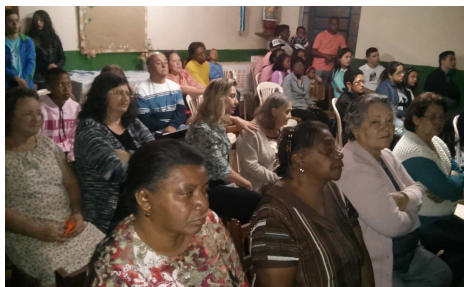
Público presente no “Luz e Consolação”