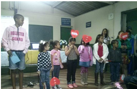
Crianças e jovens no “Luz e Consolação”

D omingo, 3 de agosto, aconteceu no Centro Espírita “Luz e Consolação”(Araxá), reunião festiva de inauguração das novas instalações da Casa da Sopa. Grande público compareceu para prestigiar as atividades desenvolvidas pelas crianças e jovens. Muita alegria!