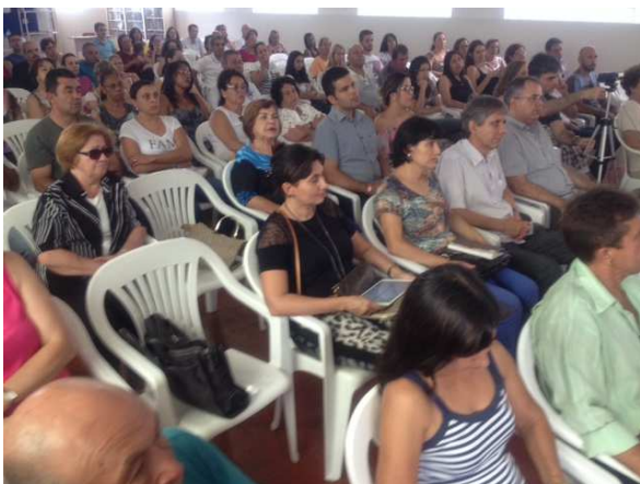
Público presente no Caminheiros do Bem

Folha: Muito obrigado! Deus lhe abençoe.