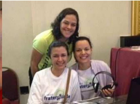
Equipe da Web Rádio Fraternidade com transmissão ao vivo, pela internet, do Congresso Médico-Espírita de Minas Gerais - O homem sadio.